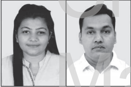
દર્શિતા ભરત ખેતશી ગડા સામખીયારી