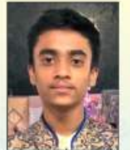
SIDDHA JAYANTI RAYSHI GALA Trambo SSC - 90.60%