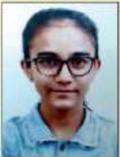
VRUTI VIJAY KANJI GALA Nutan Trambo SSC - 93%