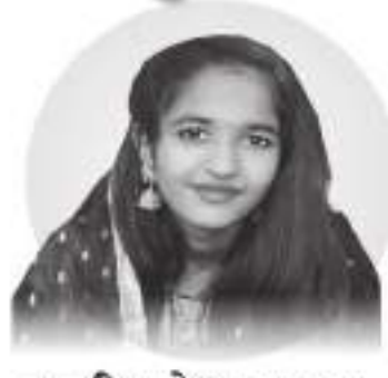
હસ્તી મહેશ ગાલા